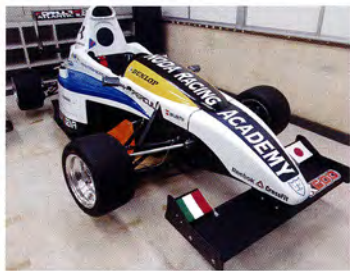
イタリア製フォーミュラモテナ