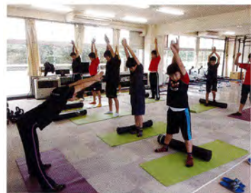
医学的根拠に基づいた フィジカル・メンタルトレーニング