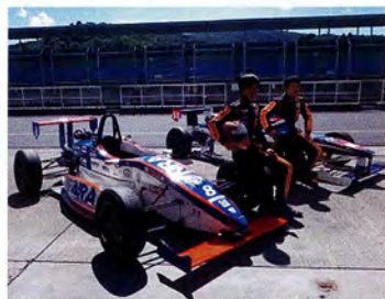
岡山国際サーキット チャレンジカップへの参戦