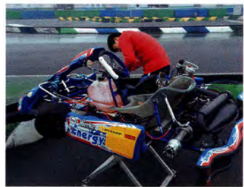
マシン整備・セッティング