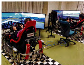
世界初7軸シリンダを使用した Access製ドライビングシミュレータ